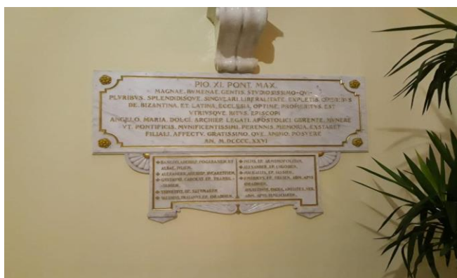
Placa de la intrarea în sediul Nunțiatunii apostolice

Pe de o parte, Palatul, fostă reședință arhiepiscopală romano-catolică, își leagă cea mai mare parte a existenței sale istorice ca locație a Ambasadei vaticaneze din București. Ajuns aici, ești întâmpinat chiar după ușa de la intrarea holului de acces de o masivă placă de marmură, încastrată pe peretele din partea stângă a spațiului de primire a oaspeților. Pe ea sunt dăltuite cu litere aurii numele unora dintre arhierii catolici, care au trăit în acest spațiu geografic, precum și anul MDCCCXXVI. Deși astăzi toți aceștia au trecut la cele veșnice, au devenit, între timp, adevărate pagini de referință ale istoriei ecleziastice românești.