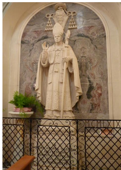
Statui ale Nunțiuului Cassulo situate lângă criptă și în fața școlii sale primare